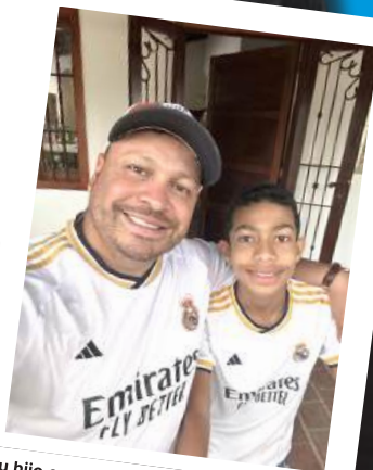
Su hijo es su piedra angular. Lo mejor que le ha pasado en la vida es tener un hijo

Su enfoque es crear contenido que no solo sea atractivo, sino que también genere resultados tangibles para sus clientes.